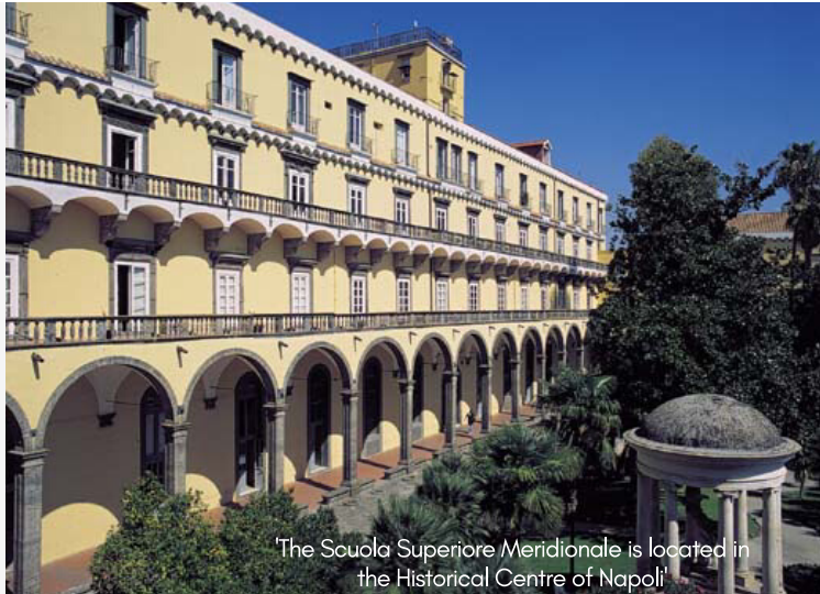
The Scuola Superiore Meridionale is located in the Historical Centre of Napoli.

The Scuola Superiore Meridionale launches an innovative and unique research opportunity for students